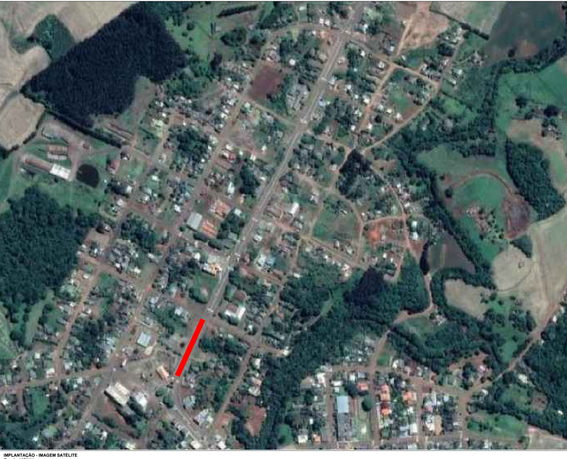
IMPLANTAÇÃO - PLANTA DE LOCAÇÃO DA AVENIDA SETE DE SETEMBRO TRECHO 01