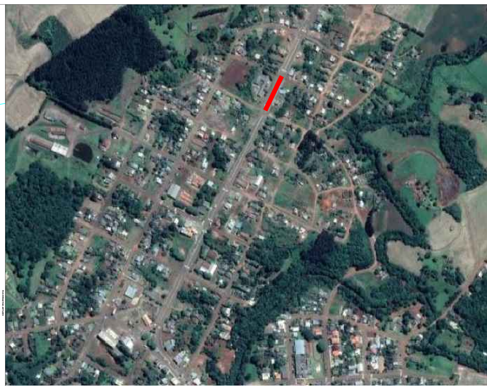
IMPLANTAÇÃO - IMAGEM SATELITE Escala VISUAL