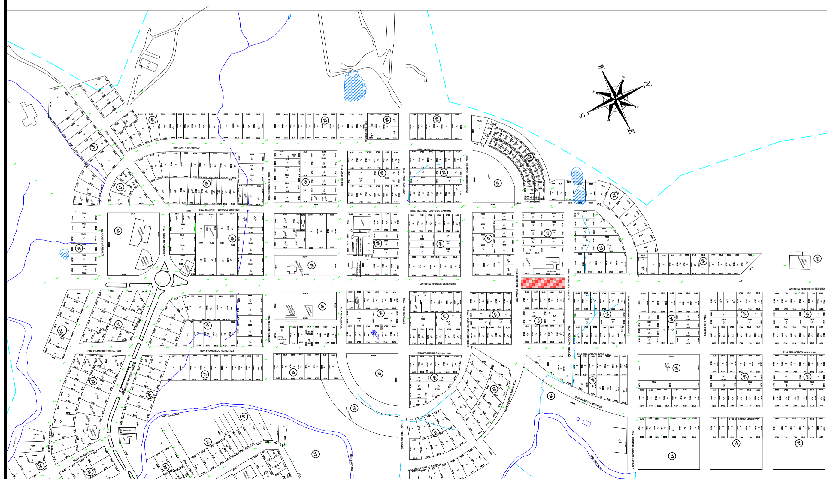
IMPLANTAÇÃO - PLANTA DE LOCAÇÃO DA AVENIDA SETE DE SETEMBRO TRECHO 05