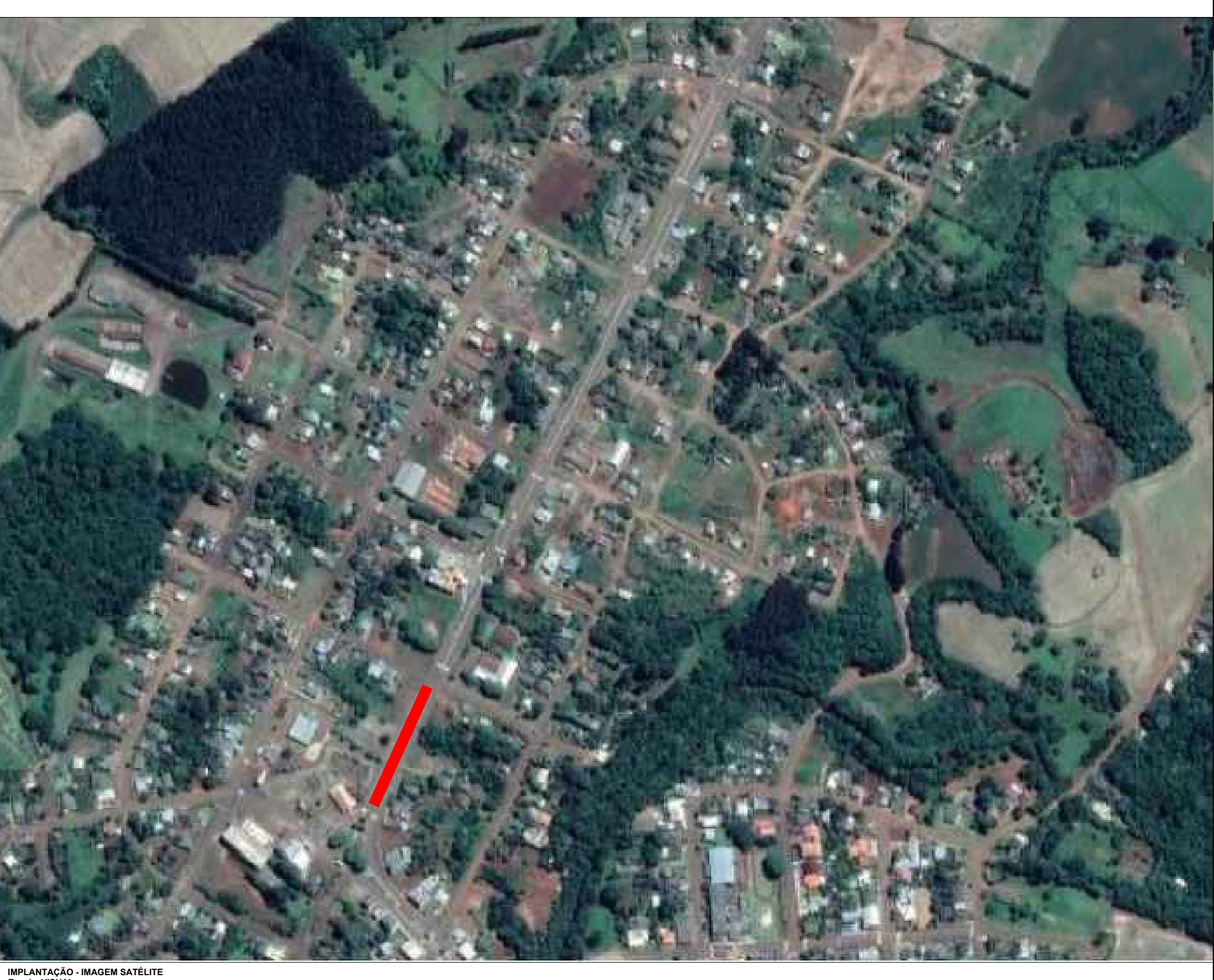
IMPLANTAÇÃO - IMAGEM SATELITE Escala VISUAL