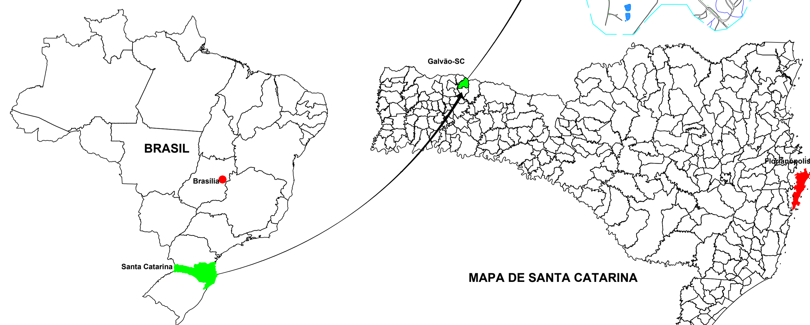
Planta de Localização Escala Visual