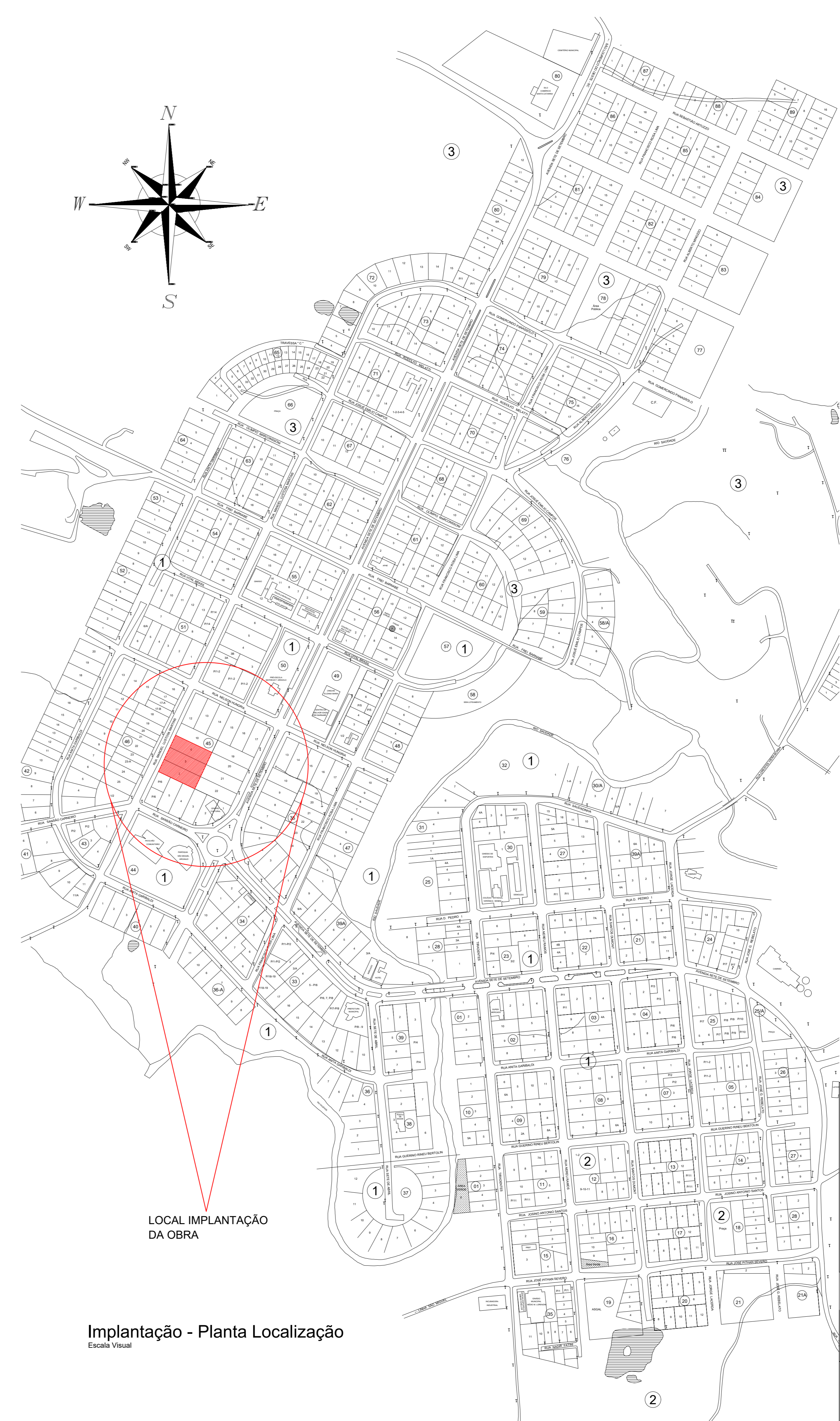
Implantação - Planta Localização Escala: Visual