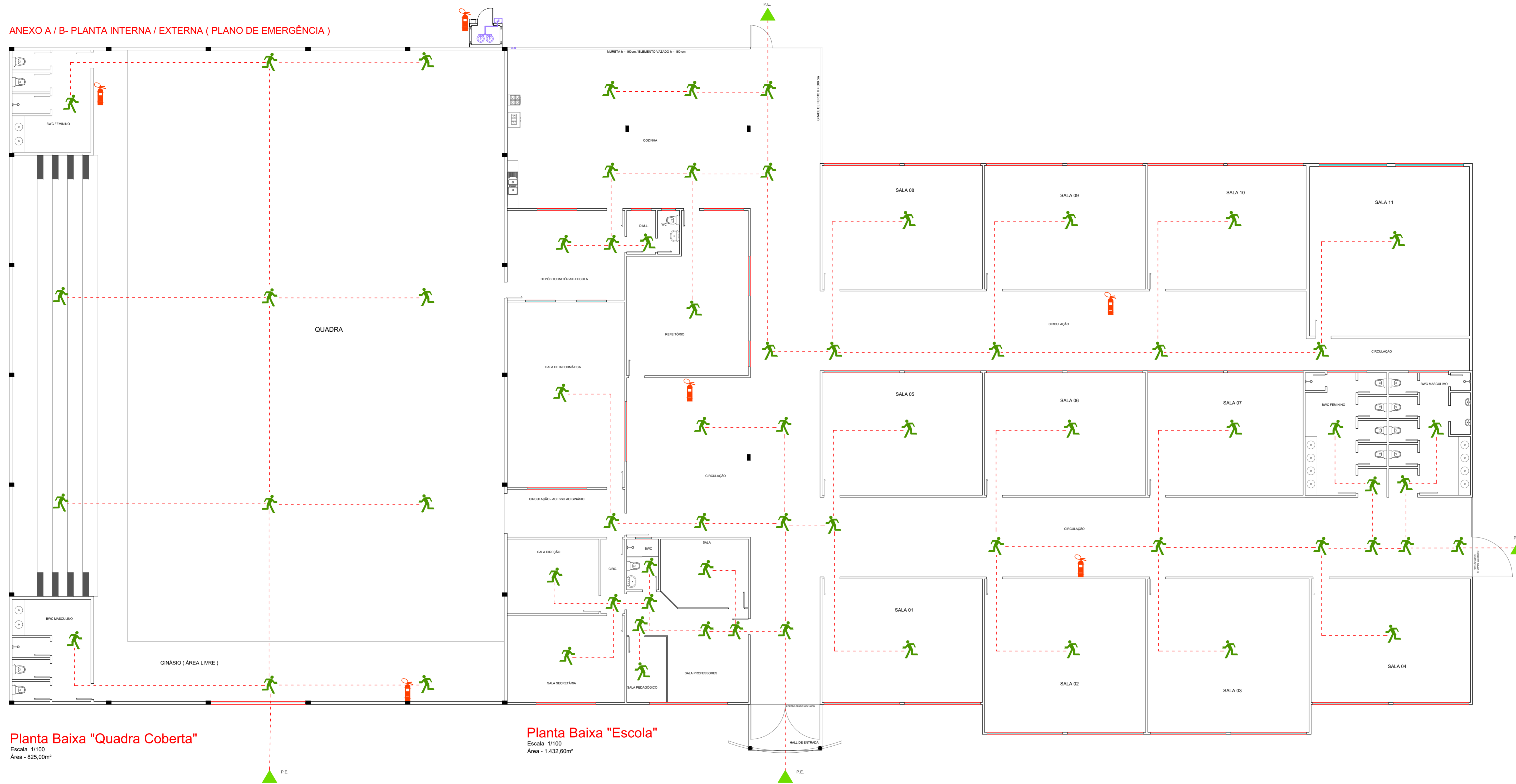
Planta Baixa "Quadra Coberta" Escala 1/100 Área - 825,00m²