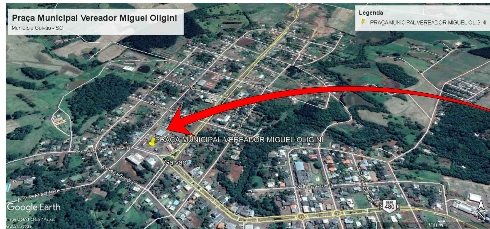
LOCAL DE IMPLANTAÇÃO PRAÇA