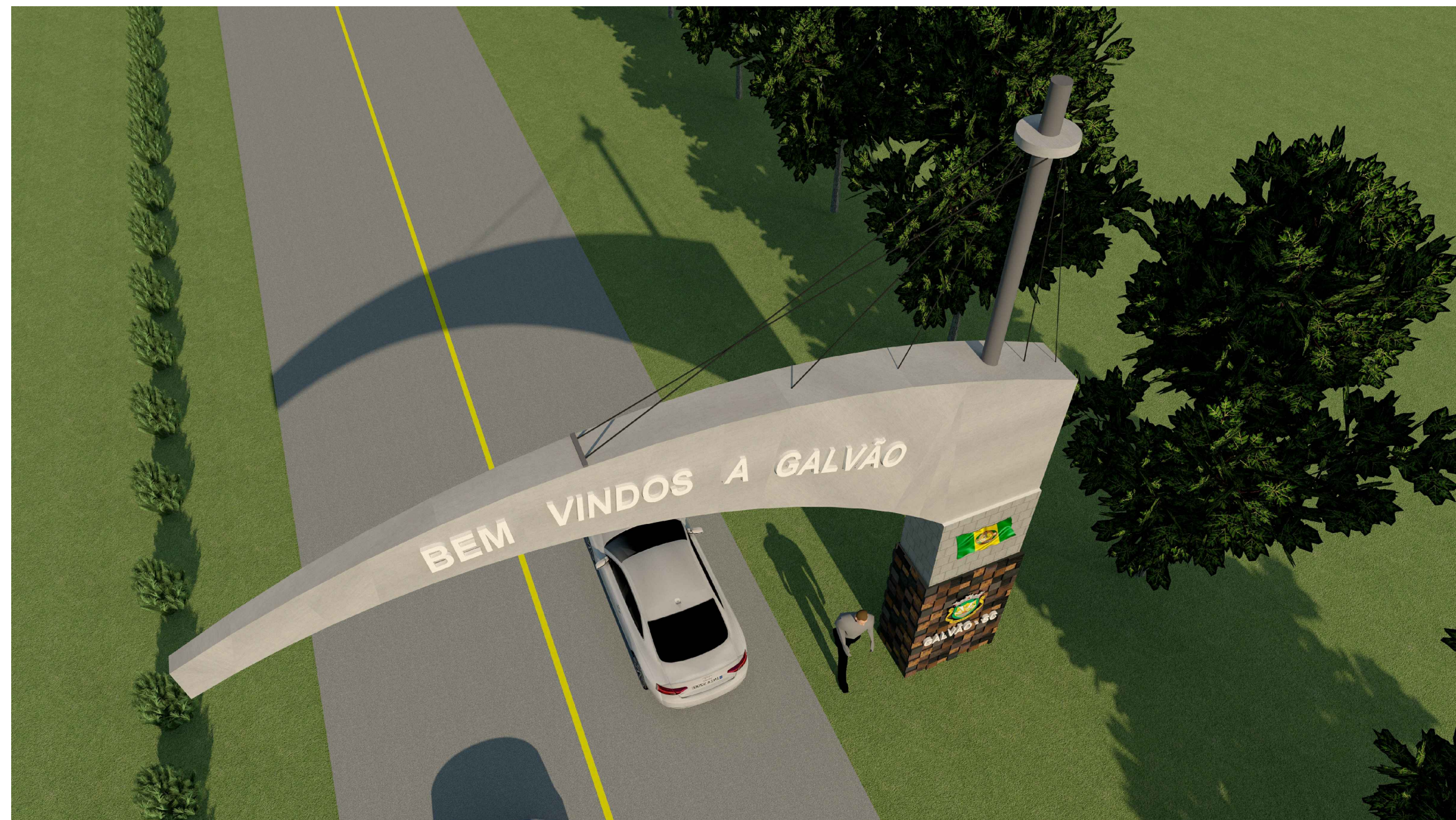
Vista Perspectiva Escala 1/100