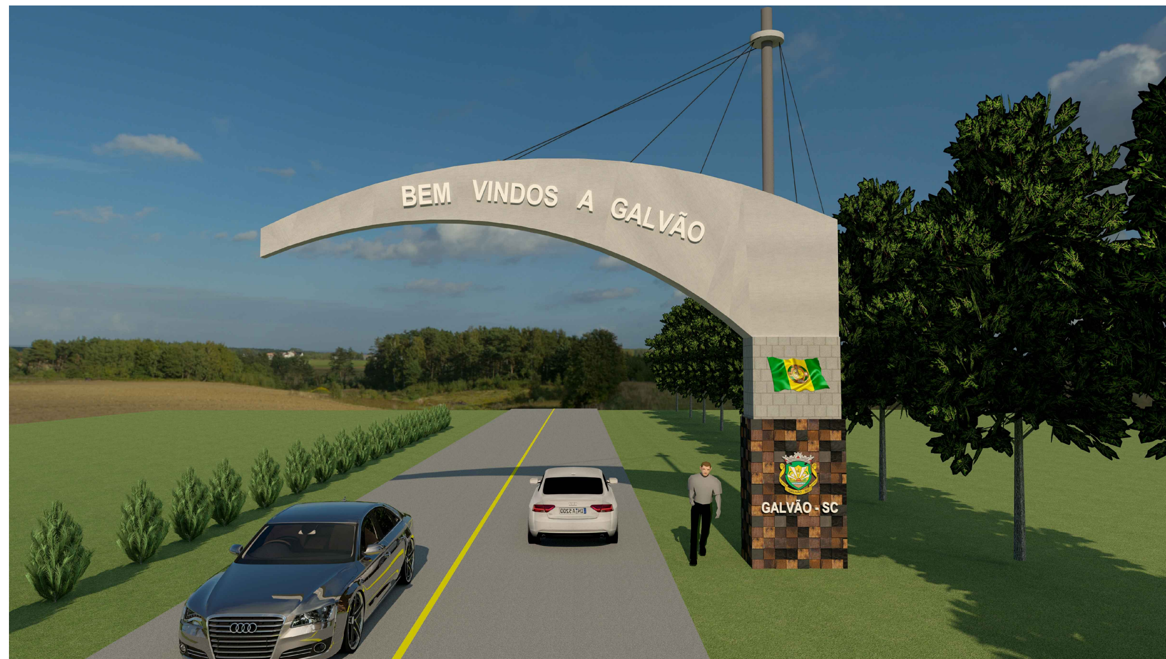
Vista Fachada 01 Escala 1/100