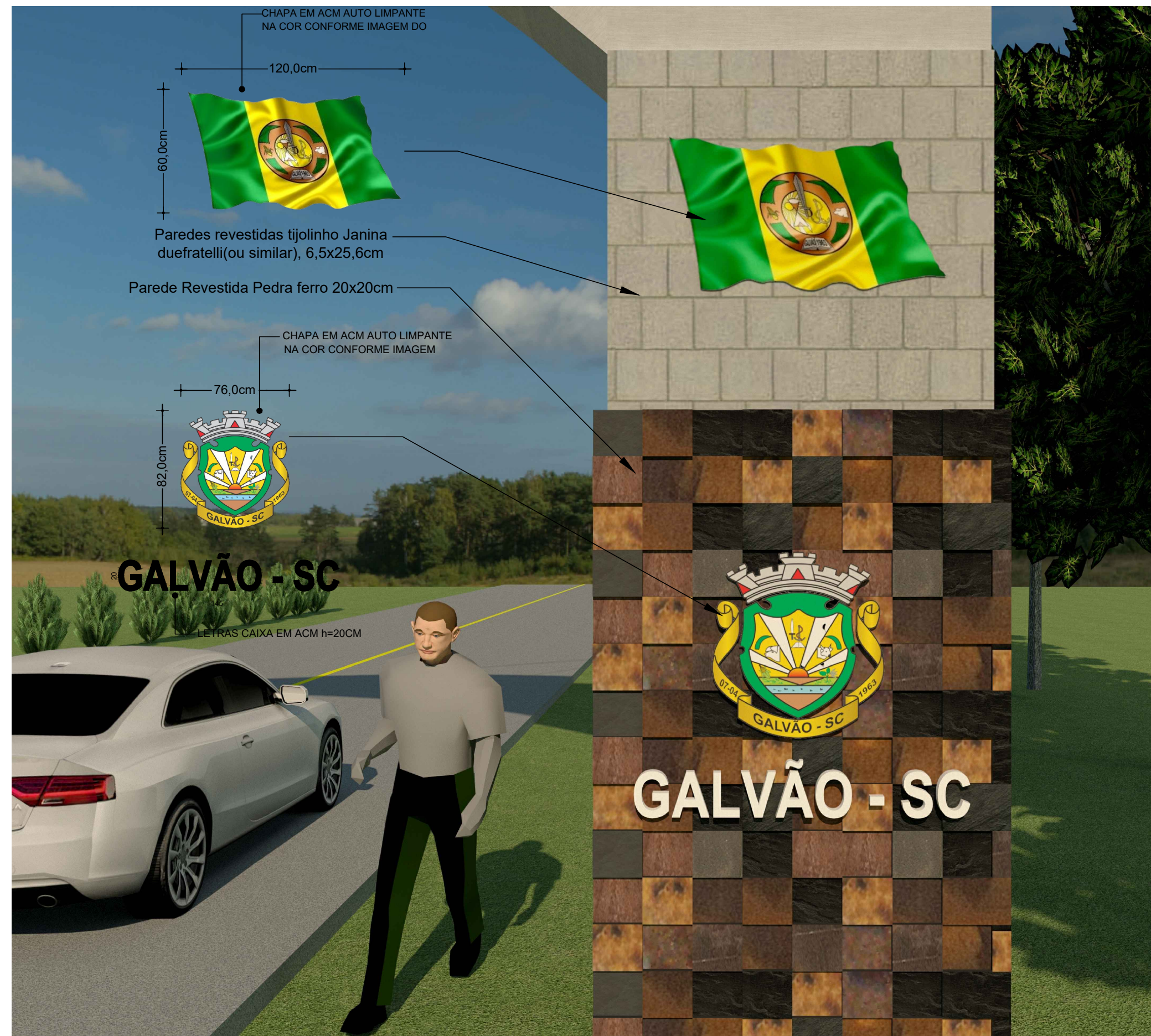
Detalhe Escala Visual