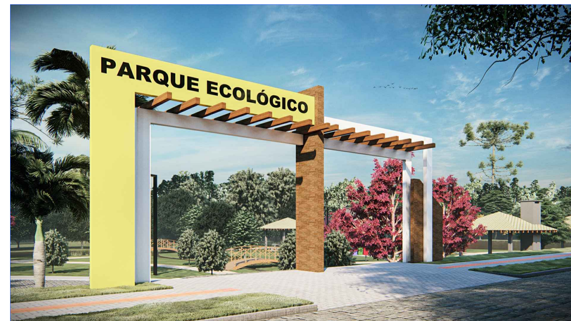
IMAGEM 02 - PORTAL