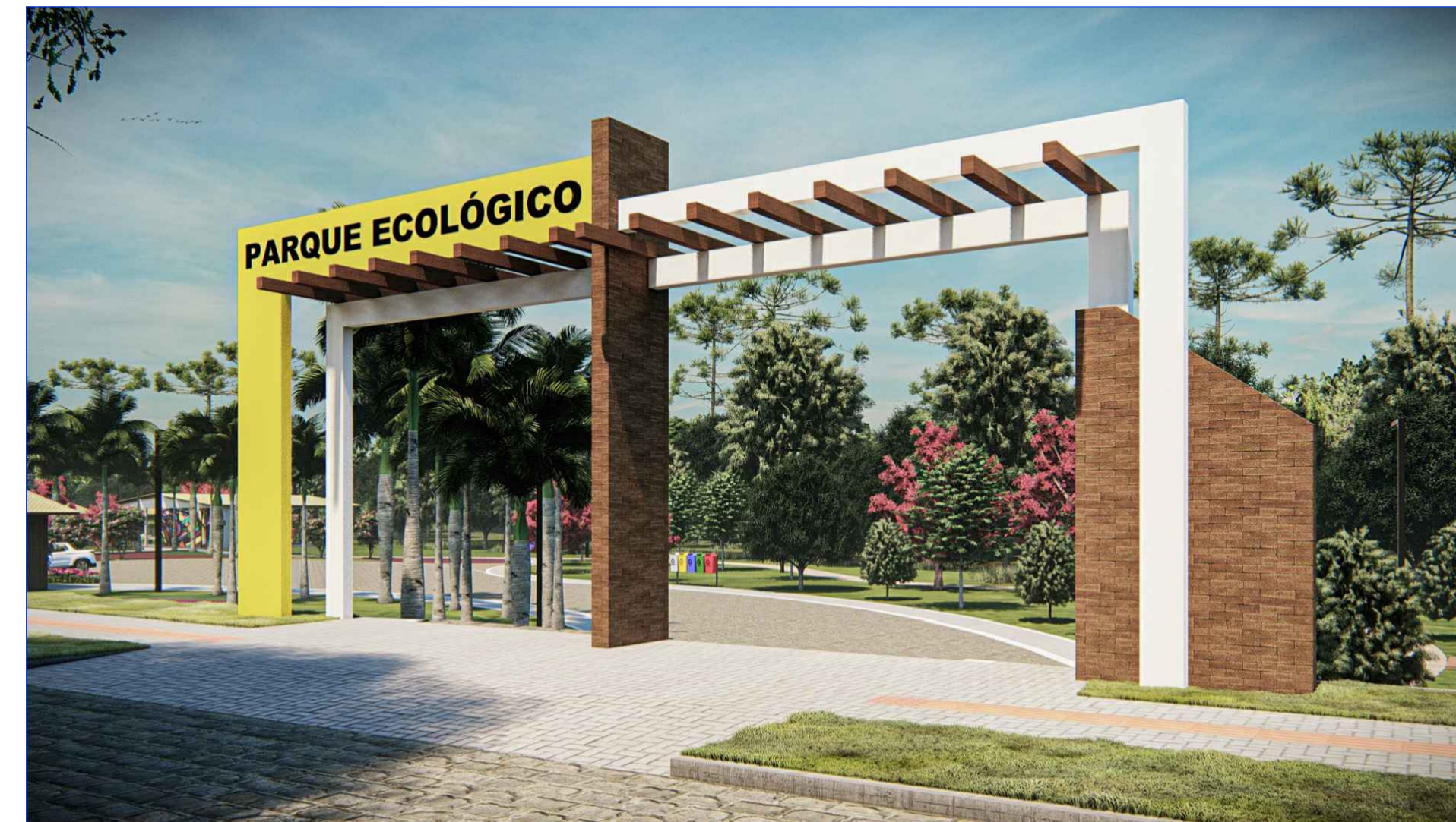
IMAGEM 01 - PORTAL