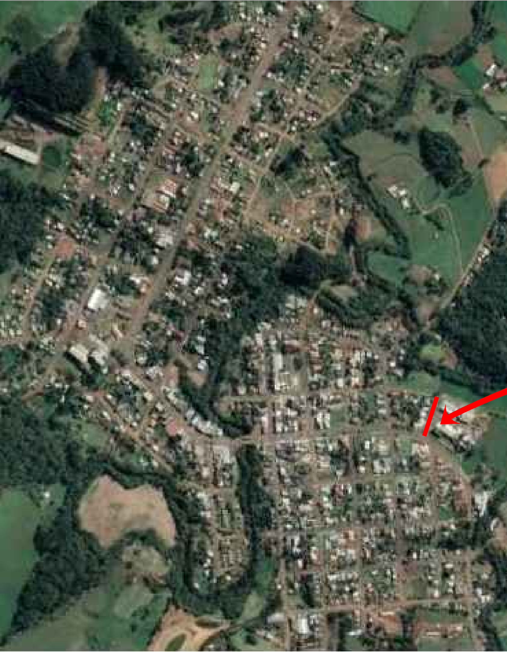
LOCAL DE IMPLANTAÇÃO RUA JOSÉ G. REBELATTO - TRECHO 02