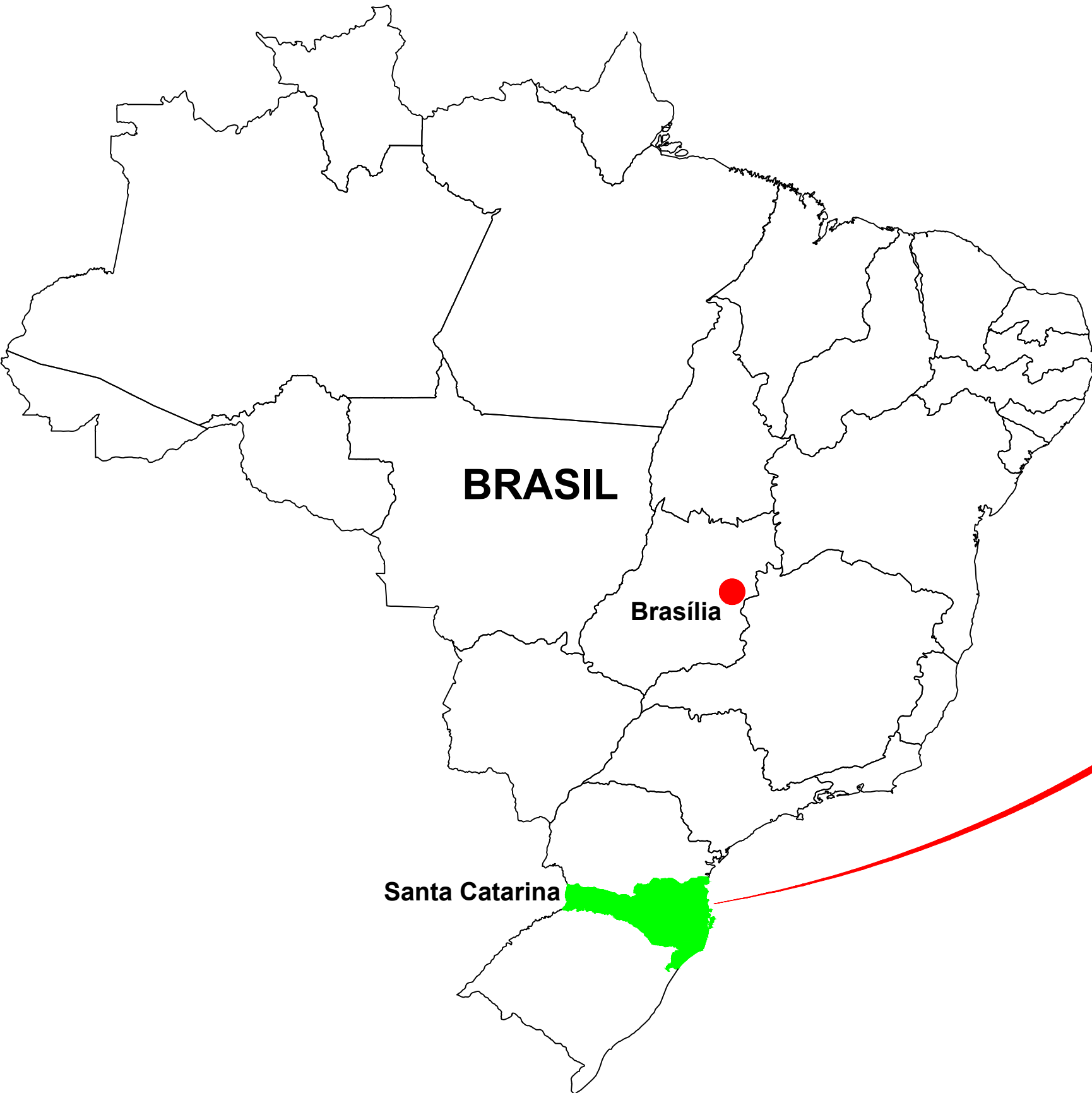
MAPA DE SITUAÇÃO ESCALA VISUAL