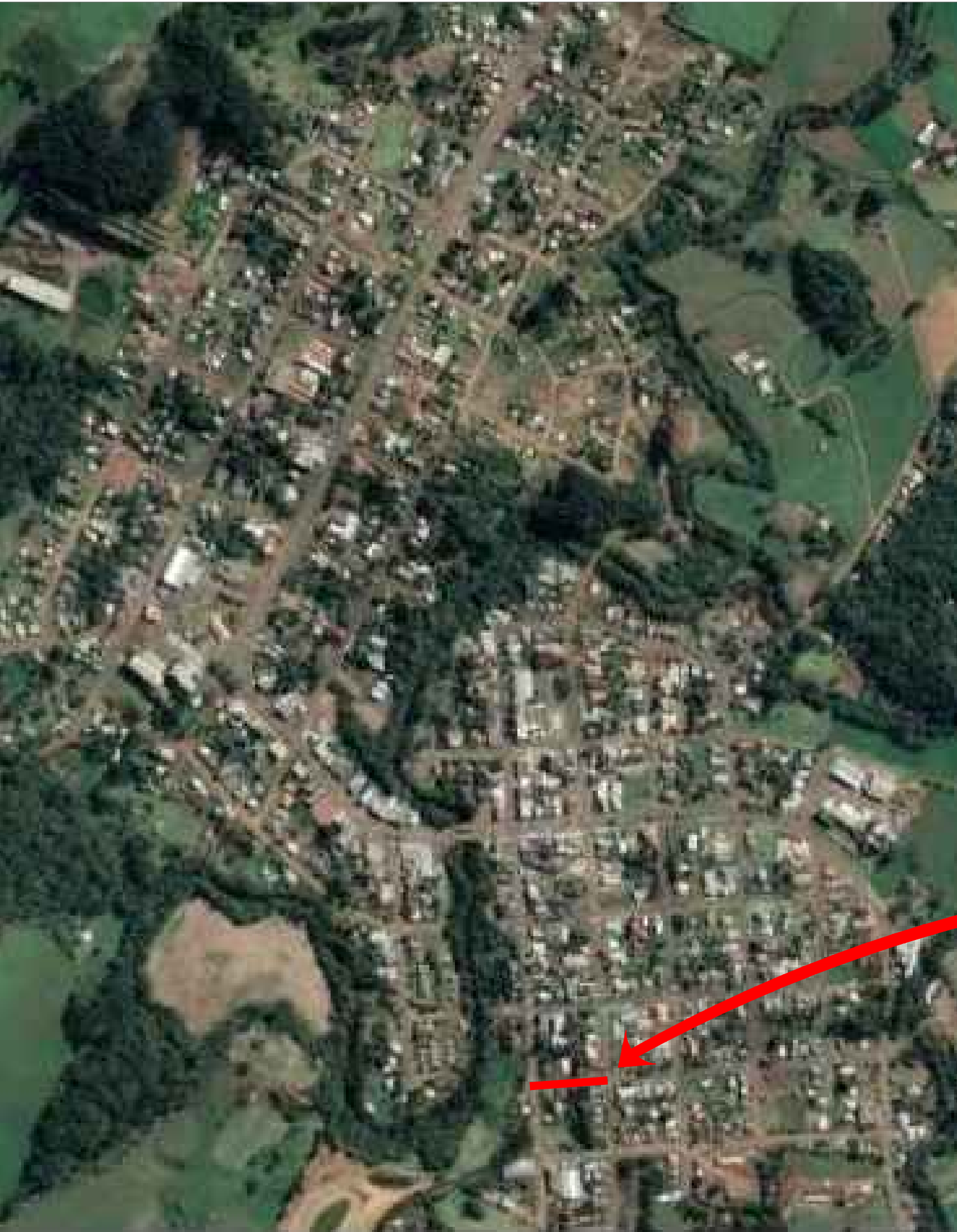
LOCAL DE IMPLANTAÇÃO RUA JOZINO A. DOS SANTOS