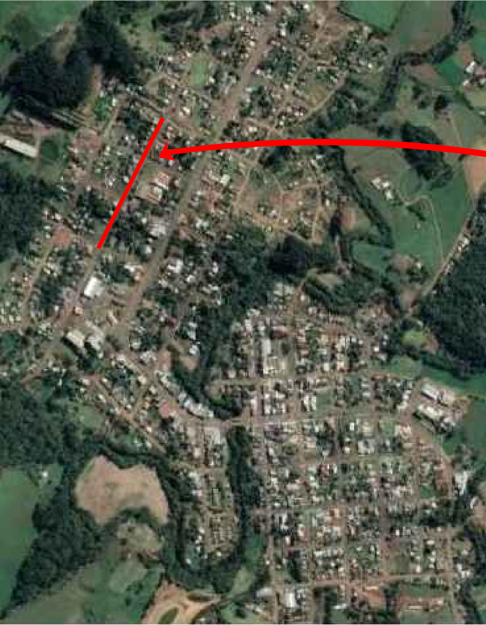
LOCAL DE IMPLANTAÇÃO RUA MANOEL LUSTOSA MARTINS